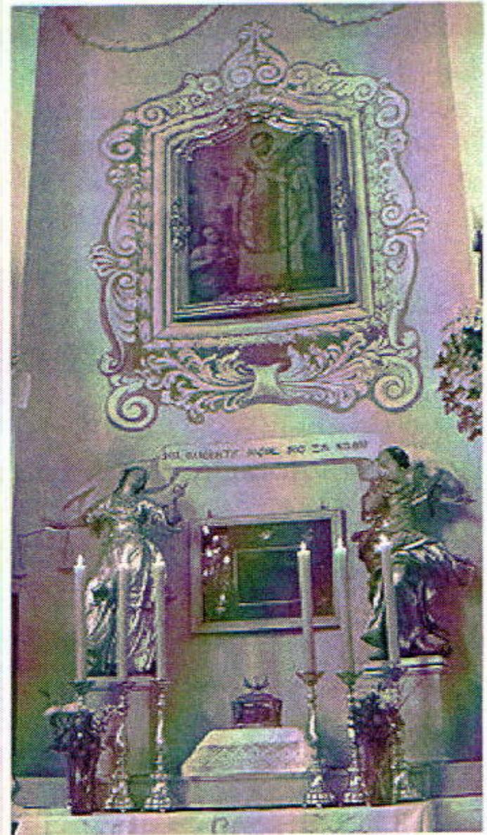
Altar de san Valentín (con