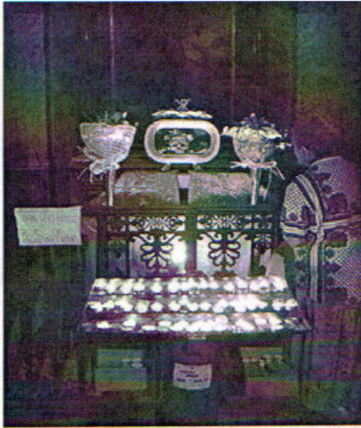
Reliquia de san Valentín, en la iglesia Santa María en Cosmedín (Roma), frente a la Plaza de la Boca de la Verdad