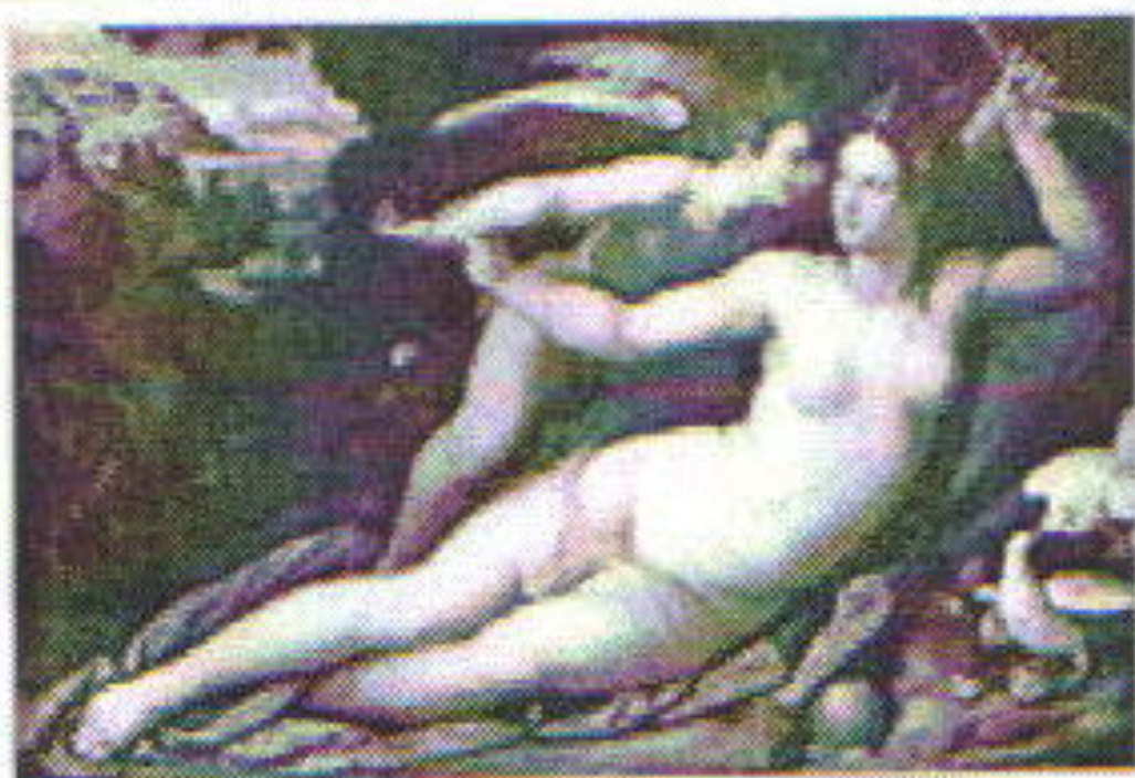
Venus y Cupido , de Alessandro Allori. Museo Fabre, Montpellier.