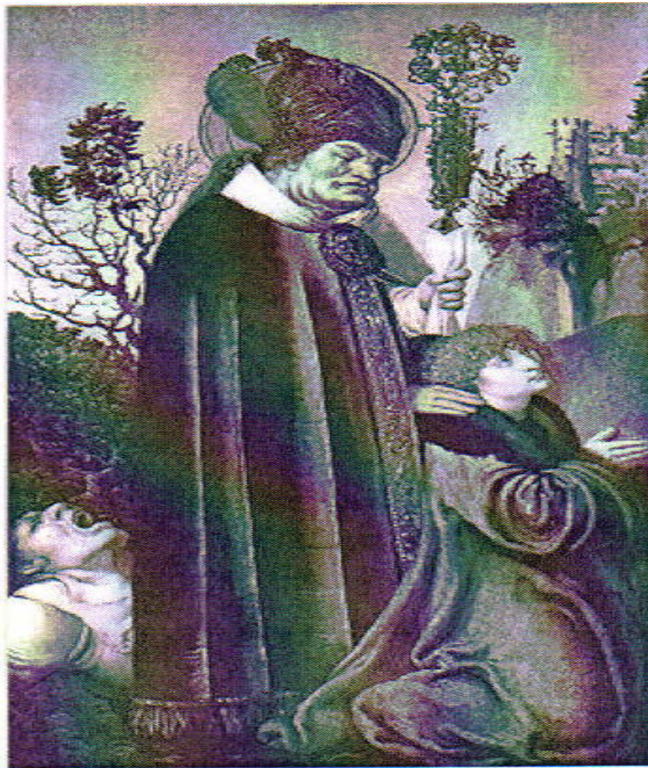
San Valentín con báculo (Wittenberg, 1502-1503, 91 x 49 cm) de Lucas Cranach (1472-1553) en la galería Gemälde de Viena (Austria)