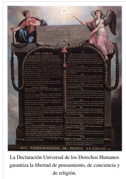
La Declaración Universal de los Derechos Humanos garantiza la libertad de pensamiento, de conciencia y de religión.

La libertad de culto o libertad religiosa originalmente nace identificada con la libertad de conciencia, sin agotarse ésta en aquéllas. En efecto, la asociación entre moral y religión instrumentalizada en el Derecho lleva a la identificación del problema de la imposición jurídica de la religión con la afectación de la reserva de la libertad de conciencia de parte de todas las personas. Lo anterior se manifestó en la consagración por parte de las colonias angloamericanas, por ejemplo Rhode Island, de la reserva de la libertad de conciencia frente a la legislatura temporal. Sin perjuicio de lo anterior, la libertad de conciencia actualmente rebasa dichos límites, hacia cuestiones como los presos de conciencia o la desobediencia civil.